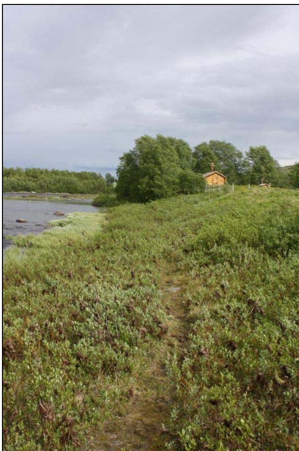
Foto – Kantsonen mot elva må bevares p.g.a. erosjon, men åpenhet og sikt er viktig å bevare. Her er vierkrattet slått vel langt ned, det anbefales en høyde på 50 cm.

I de markerte områdene bør vegetasjonen holdes lav for å sikre åpenhet, sikt og tilgjengelighet, men p.g.a. erosjonsproblematikk må ikke krattvegetasjonen fjernes. Det anbefales at krattet kappes ned til 50 cm, som beskrevet over. Det er ikke registrerte kulturminner i kantsonen utover Kvitberget, Skoltefossen, Trifon-kulpen og jordvollen ved Kvitberget.