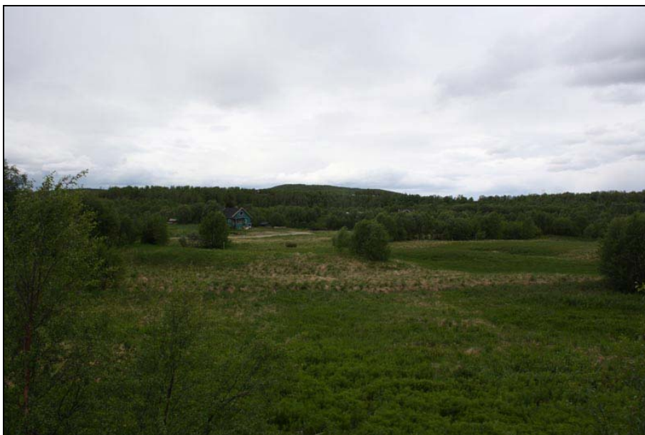
Foto – Østre engareal ligger utenfor kjerneområdet men bør fortsatt holdes åpent.

Arealen bør holdes åpent, men ligger utenfor kjerneområdet. Arealene bør slås minimum hvert annet år, oftere om mulig. Området kan slås maskinelt eller beites. Området bør strekke seg opp til parkeringsplassen ved hotellet slik at sikten inn mot kjerneområdet ivaretas. Oppslag av geitrams her bør slås oftere. Selv om det ikke er registrerte enkeltkulturminner i området må det ikke foretas pløying og annet jordarbeid som er dypere enn tidligere uten samtykke fra Sametinget. Arealen kan fortsatt nyttes til beite eller innmark i henhold til kulturminnelovens § 6.