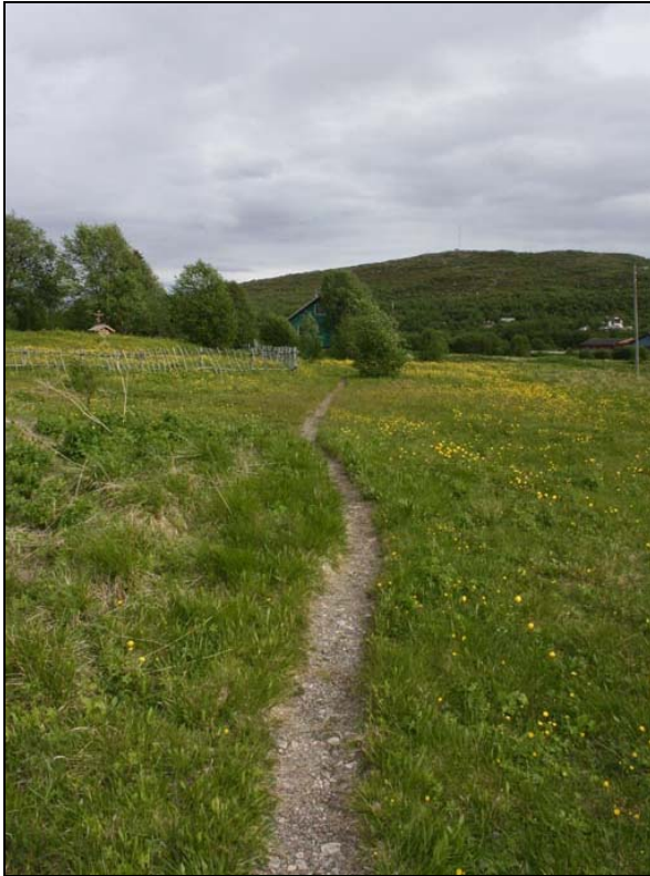
Foto – Ved å slå årlig langs viktige stier blir disse mer markert uten at det trengs gjøre inngrep i grunnen.

- Langs bekker i åpne områder slås kanter hvert annet år. Vegetasjon i vann slås ikke. Sårbare arter i denne sonen slås ikke. Vedlagte kartbilag viser hvilke soner som anbefales slått. Kartet viser ikke forekomster av sårbare arter, disse må ivaretas særskilt.