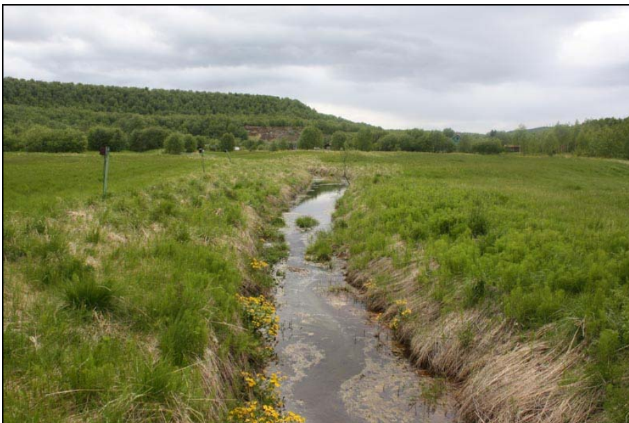
Foto – Langs bekker som går i åpne landskap må kantsonene slås med jevne mellomrom for å hindre at de gror igjen.

- Langs bekker i åpne områder slås kanter hvert annet år. Vegetasjon i vann slås ikke. Sårbare arter i denne sonen slås ikke. Vedlagte kartbilag viser hvilke soner som anbefales slått. Kartet viser ikke forekomster av sårbare arter, disse må ivaretas særskilt.