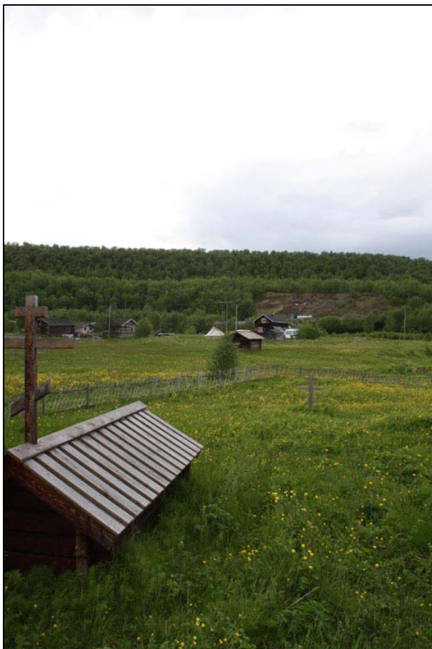
Foto – Kjerneområdet består av artsrik natureng, spesielt i sonen på og mot kirkegården.