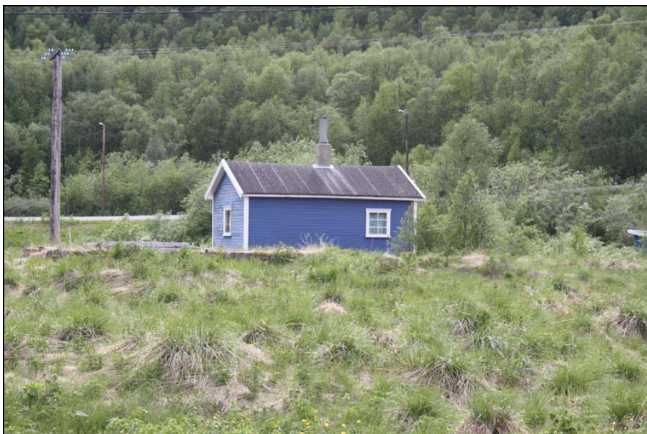
Foto – Ildtuer (sølvbunke) er et problem i området. Disse danner kraftige tuer som vanskeliggjør slått og skjuler viktige terrengformasjoner.

Ildtuer (Sølvbunke) er et problem på grasarealene, spesielt der arealene har vært gjødsla. Tuene skaper problemer for slått, vanskeliggjør ferdsel og lager et tuet landskap som skjuler de terrengformasjonene som finnes i området. Tuene bør fjernes i så stor utstrekning som mulig, tuene sages eller skjæres bort så langt ned mot bakken som det går an. Bruk av redskaper og maskiner som kan skade eller ødelegge kulturminnet eller kulturlag må unngås.