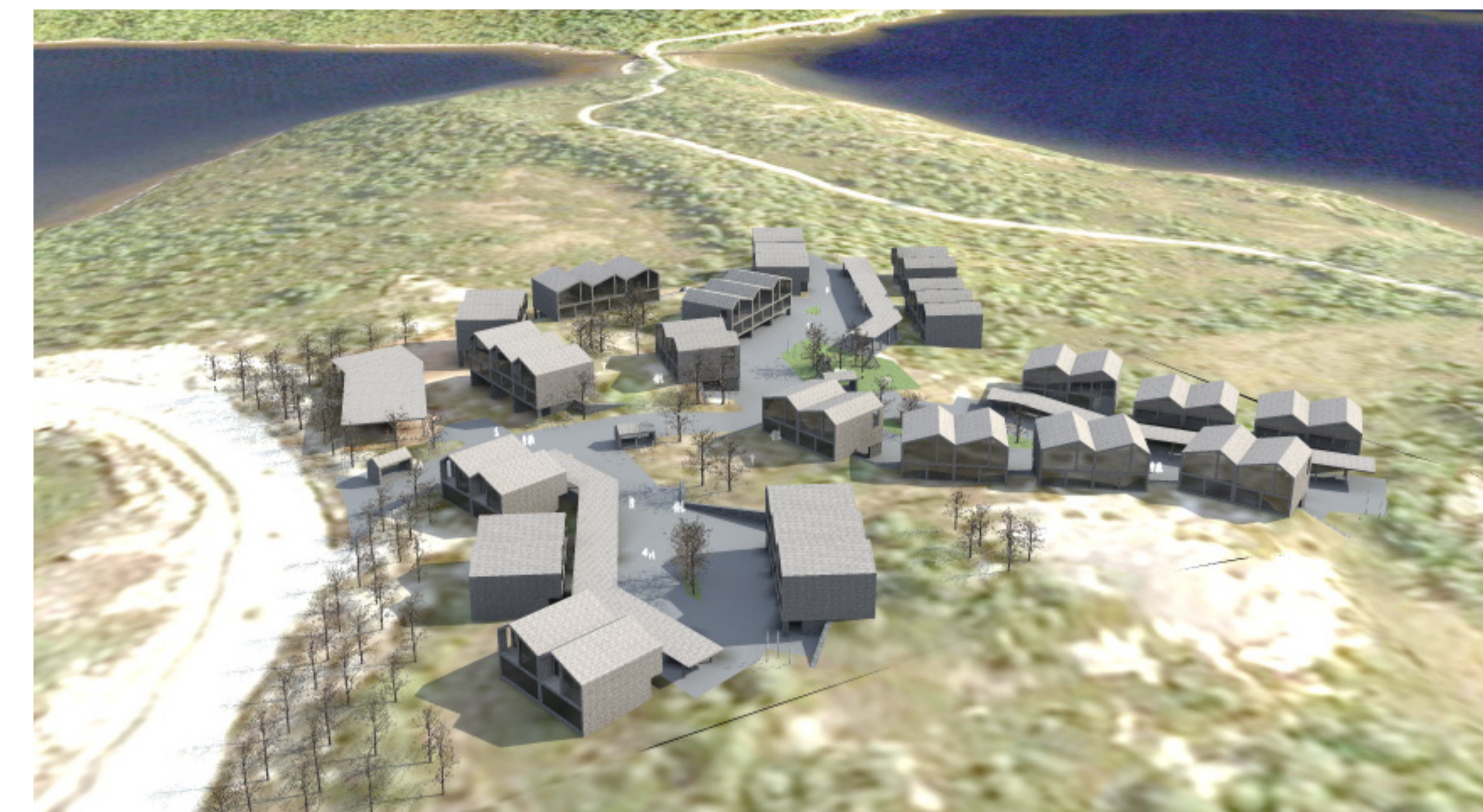
Oversiktsperspektiv mot sørøst