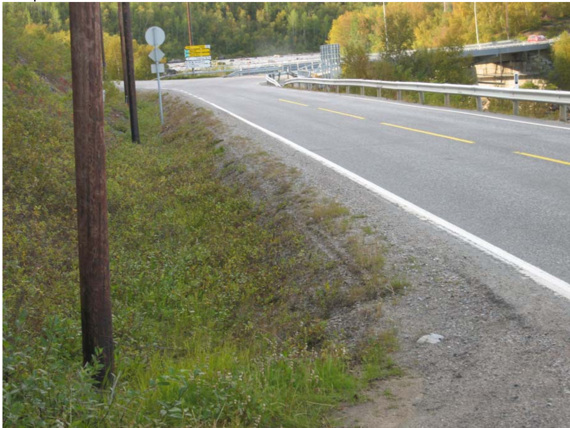
Bildet viser siktforholdene fra adkomstveien mot Neiden bru.

Fartsgrensen er 60 km/h gjennom området der avkjørselen er lokalisert. I og med at siktforholdene er minimum 100 meter til begge sider, vurderes siktforholdene som akseptable.