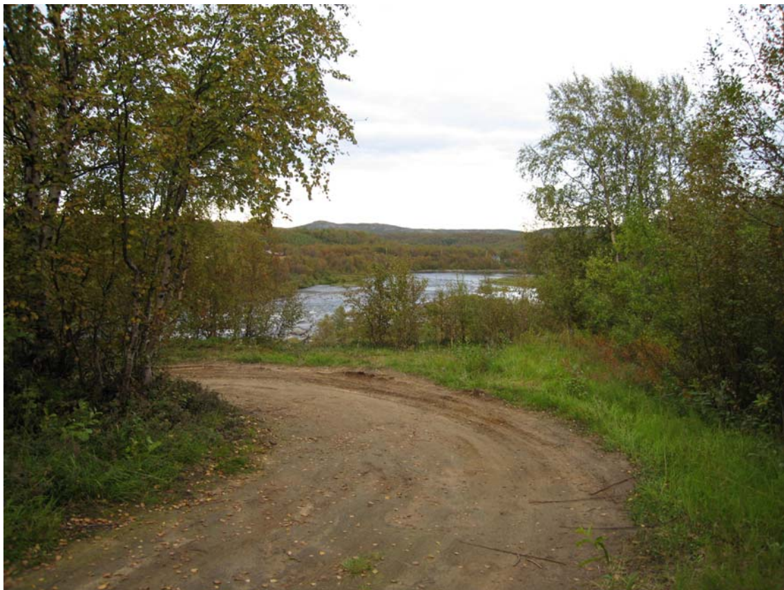
Bildet viser adkomstveg der den svinger ned mot E6. Bakkekant i bakgrunnen. Skoltebyen ligger i området bildet er tatt, men bakkekant og vegetasjon medfører at denne ikke kan ses.

Den østlige/sørøstlige delen av planområdet er lokalisert i området rundt bakkekanten ned mot E6. I dette området er det igjen mer frodig, og også her er middels stor bjørkeskog er dominerende skogtype.