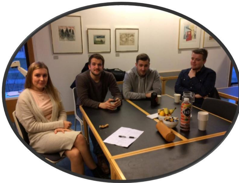
Bilde fra gjestebud «bortestuderende»

Før prosjektoppstart med metoden gjestebud, var vi i kontakt med Svelvik kommune, som metodeutvikler for gjestebudmetoden, og med andre kommuner som hadde brukt metoden, for å sjekke erfaringer. Imidlertid hadde ingen kjennskap til at gjestebudsmetoden tidligere var brukt på barn eller ungdommer. Man hadde utelukkende erfaringer med metoden brukt på voksne. For oss som prosjektgruppe ble dette dermed enda en spennende erfaring og motivasjon for å bruke metoden gjestebud.